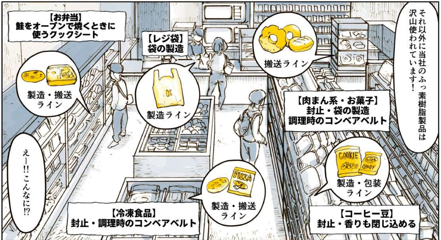
チューコーフローベルト

ふっ素樹脂製のベルトは炊きあがったご飯の熱をとりながらほぐして形をつくる工程で使われているんです