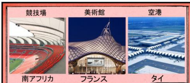
競技場 美術館 空港 南アフリカ フランス タイ